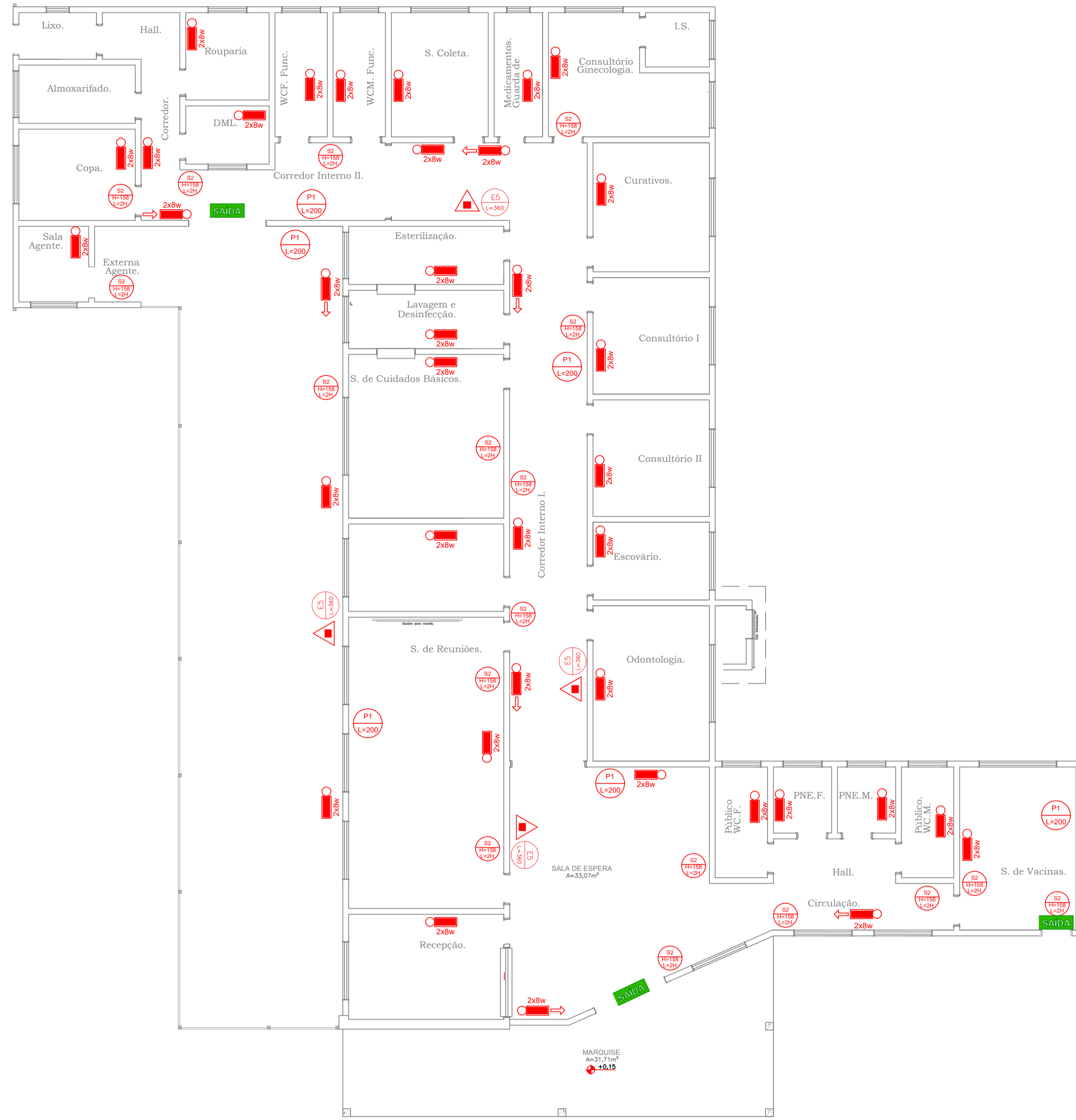
PROJETO DE PREVENÇÃO DE COMBATE A INCÊNDIO E PANICO Escala de Projeto.:1/75